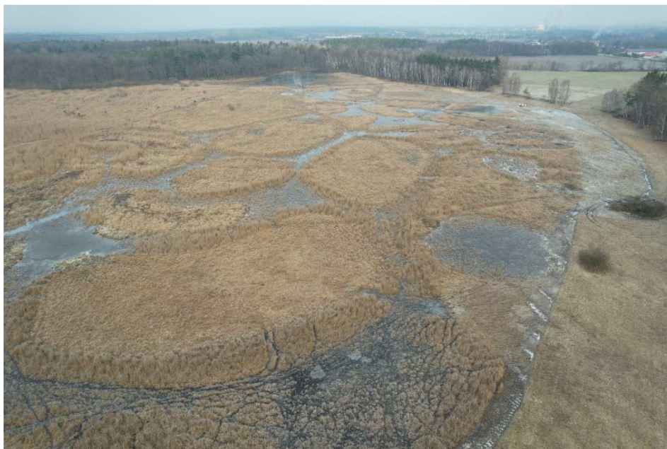
Stav lokality v předjaří r. 2023 (10. 2. 2023)

Na pastvě v PR Baroch spolupracují Krajský úřad Pardubického kraje (jako orgán státní správy), Agentura ochrany přírody a krajiny ČR (AOPK ČR), regionální pracoviště Východní Čechy (jako subjekt s příslušností hospodařit na pozemcích ČR a zároveň odborný garant) a ochránářské spolky.