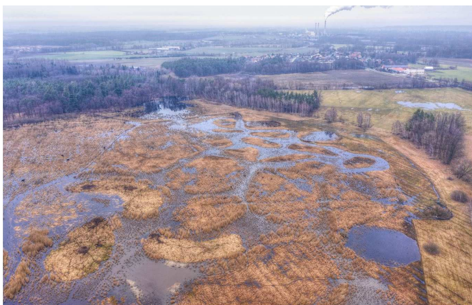
Stav lokality v předjaří r. 2024 (16. 2. 2024)